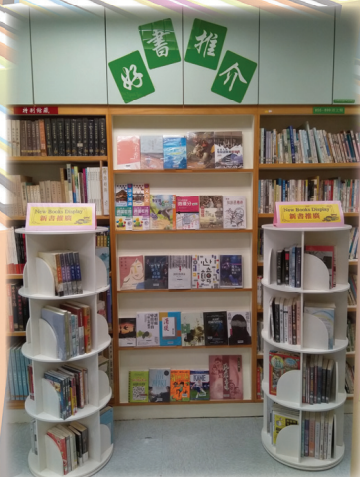
歡迎同學到圖書館借閱各類圖書。

另外，本校圖書館於上學年購入大量新出版書籍。每本書籍均由老師精心挑選。書本內容涵蓋歷史、哲學、文學、科學、藝術、社會、文化等各個領域。此外，本校亦已添購多種應考DSE的補充練習，供各位同學到圖書館借閱。