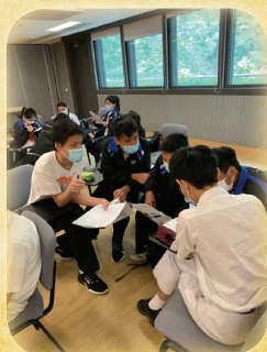
Becoming a Detective - a group of detectives work hard to connect the dots

Mystery was afoot at the Ko Shan Theatre, where STFA SWC students traveled to take part in SCOLAR's "Becoming a Detective" workshop. The famous Sherlock Holmes novel, "The Hound of the Baskervilles" was examined, and our detectives were quick to crack open the case! This was our third year participating in the workshop, in which students could learn fun ways to improve their creative writing skills.