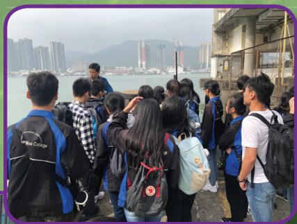
同學專注聆聽 老師分享