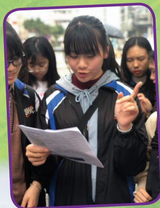
參與同學分享組內學習成果