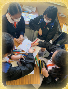
Makerspace - students work hard to design a logo for their new company