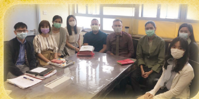
Makerspace - SWC teachers meet with other members of the Makerspace program from Hong Kong Polytechnic University and the EDB