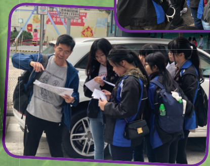
負責老師指導同學 完成分組任務