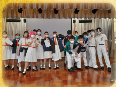
Drama - students have some fun while preparing for this year's STFA SWC drama performance

Aaaaaand...ACTION! Form two students are working hard to prepare for their performances at the STFA SWC Drama Day 2020. Each and every student has a role in both the acting and production of one of five different performances, ranging from comedy to horror. Students are learning to speak with tone, emotion, and projection, while using their creativity to design costumes, stage sets, music, and lighting effects. Stay tuned for more information on the dates of our performances!