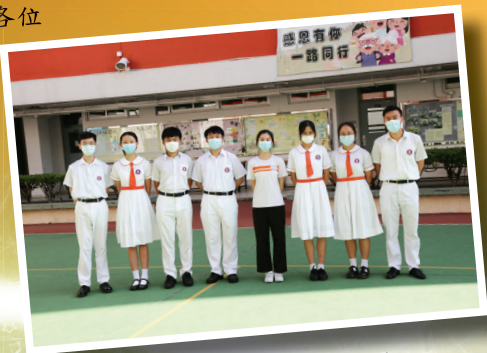
今屆領袖生長及六位隊長

領袖生分享自己的經歷和得着，對領袖生這個團體更有着依依不捨的心情。不過我十分感謝所有領袖生的配合和鼓勵，以及包容我這個處事比較瘋狂的人，我相信有你們的協助下，未來領袖生必定會發展得越來越好。最後感謝全體訓育組老師給我們的支援，希望來年領袖生團隊會努力堅守崗位，祈望各位同學都能夠繼續與領袖生合作，保持良好的校園秩序。