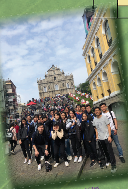
師生於大三巴留影