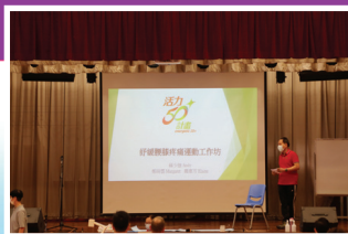
第一次發展日主題為舒緩腰膝疼痛運動工作坊

本校於2020年9月30日（星期三）舉行了本學年第一次教師發展日，是次主題為「舒緩腰膝疼痛運動工作坊」，通過理論與實踐並重的活動讓教師學習正確的伸展及強化肌肉的技巧，同時配合適量、循序漸進和持之以恆的模式，藉以調整身心的健康，也減少了日常工作上帶來痛症的機會和影響。