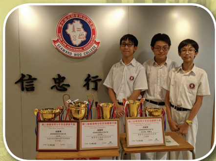
同學們得獎獎狀及獎盃