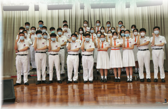
全體領袖生人才濟濟

成為領袖生經已第三年，今年亦是最後一年。過去兩年間，曾遇到不同的考驗、挫折，但直至接任領袖生長一職，才感受到當初所遇到的只是很平常的事。在處理不同事務期間，令我感悟到雖然每個人都總會有犯錯的時候，但貴乎於願意改善、學習的心態。我們永遠無法準確預測將來發生的事，惟願領袖生團隊能夠竭盡所能，協助策勵同學培養自律守規的精神，為學校分憂。