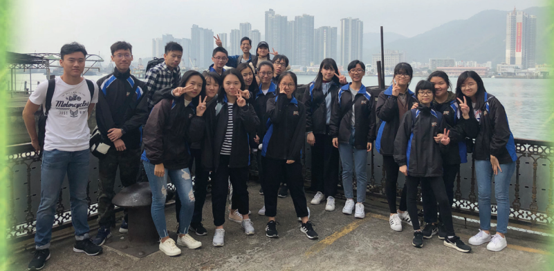
師生於澳門內港留影